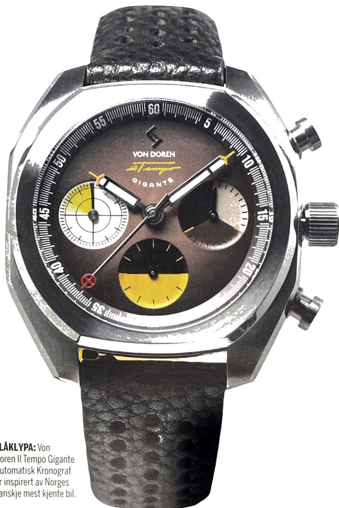
FLÅKLYPA: Von Doren Il Tempo Gigante Automatisk Kronograf er inspirert av Norges kanskje mest kjente bil.